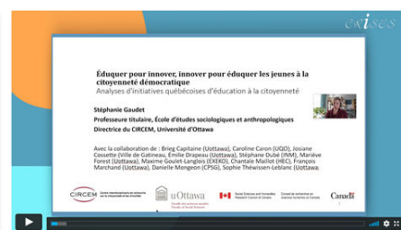
Communication « Éduquer pour innover, innover pour éduquer les jeunes à la citoyenneté démocratique »